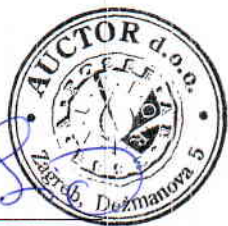
Dunja Babić, član Uprave