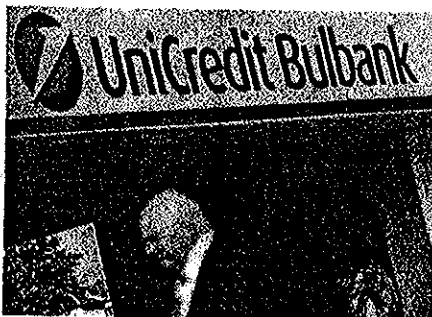
UniCredit očekuje da će manje davati potrošačkih kredita

Analiza UniCredita Banke trebaju dati adekvatan odgovor na rastuće potrebe klijenata