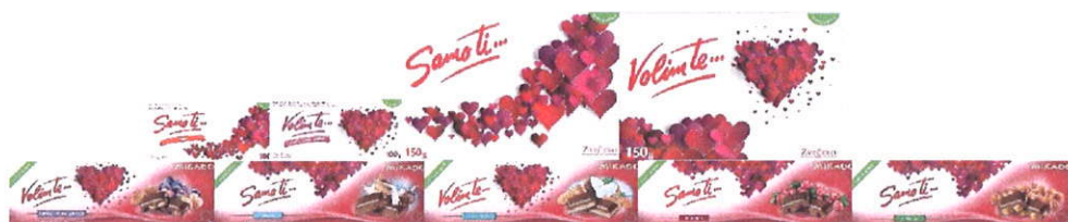
Prilog: asortiman Valentinovo

U prvom kvartalu 2016. godine lansirali smo nove proizvode. U drugoj polovici siječnja lansiran je asortiman Valentinovo koji je uključivao čokolade i bombonijere Samo ti i Volim te .