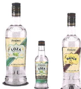
prilog: rakija Loza 1.00 i 0,10 lit, rakija Dunja 0,70 lit.

Proširen je asortiman jakih alkoholnih pića. Proizvedene su dvije nove voćne rakije Loza i Dunja , a njihova distribucija je započela u ožujku.