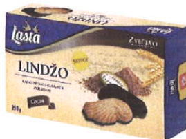
prilog: Lindžo s kakaovim preljevom 250 g

Dogovorena je marketinška suradnja s HNS-om u susret Euru 2016. godine u Francuskoj. Tijekom drugog kvartala na tržište je lansiran idejni projekt Volim Te Hrvatsko , kao simbioza Zvečevo marke proizvoda Volim Te i Hrvatske nogometne reprezentacije. Prilikom kupnje proizvoda za sve kupce pripremljena je atraktivna nagradna igra i pokloni za potrošače. Cijeli projekt je promoviran putem medija.