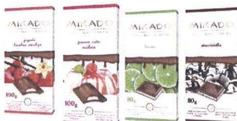
prilog: Mikado proljeće-ljeto 2015 godine

U sklopu proljetno-ljetnog asortimana lansirane su 4 čokolade Mikado slijedećih okusa: jagoda-bourbon-vanilija 100 g, panna cotta-malina 100 g, limeta 80 g i stracciatella 80 g.