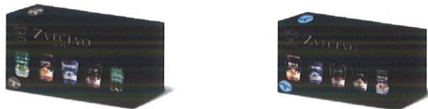
prilog: Gift pack: kontinentalni i mediteranski tip