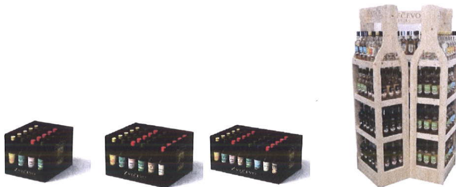
prilog: brandirani mini JAP shelf ready i drveni stalak za boce