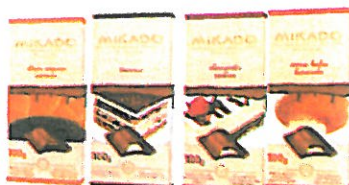
Slika 1. asortiman jesen-zima

Sukladno kontinuiranim inovacijskim ciklusima početkom listopada 2015. god., a u sklopu jesensko-zimskog asortimana na tržište su lansirane 4 nove čokolade: Choco mousse naranča 100 g , Tiramisu 100 g , Cheesecake malina 100 g i Creme brulle karamela 100 g . Zvečevo je jedinstven i prepoznatljiv na tržištu u ponudi jesensko-zimskog asortimana i na taj način jasno diferencira svoju ponudu u odnosu na konkurenciju.