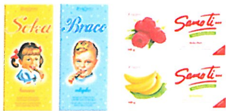
prilog: slika Seka, Braco, Samo ti novi artikli u asortimanu

Na osnovu kontinuiranog praćenja trendova na tržištu, plasirani su novi proizvodi u segmentu čokolada pod markom Seka i Braco punjene čokolade i Samo ti punjene čokolade, kao dio kontinuiranih inovacijskih ciklusa kojim se pokušava na što bolji način zadovoljiti potrebe potrošača na tržištu.