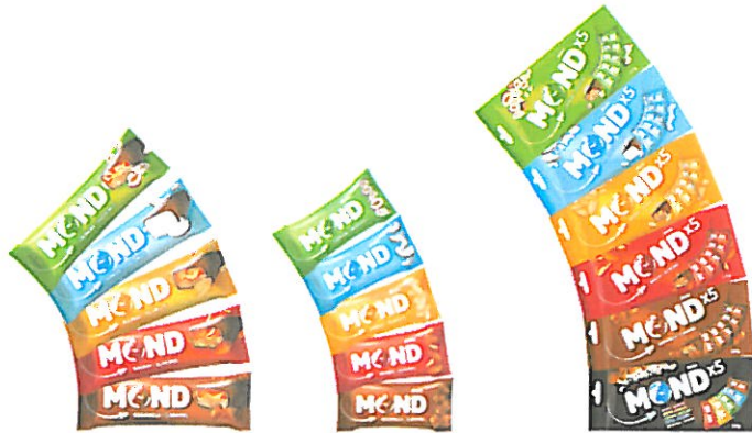
prilog: slika Mond classic, mini, multipack

Nakon završenih procesa distribucije proizvoda na tržište planirana je snažna marketinška podrška prodaji proizvoda kroz televizijsko oglašavanje, promociju na prodajnom mjestu i promoviranje proizvoda putem interneta.