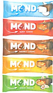
prilog: slika brend Mond

Politikom promicanja izvrsnosti i inovacija, nastavljamo kontinuirano distribuirati nove proizvode što će u budućnosti pridonijeti boljoj tržišnoj poziciji i otvoriti nove poslovne mogućnosti. Pored regionalnog tržišta na kojem smo snažnije zastupljeni planira se iskorak i na nova tržišta.