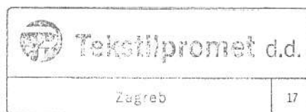
KATICA KRPAN dipl. oec.