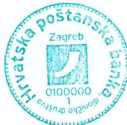
Tomislav Vučić Predsjednik Uprave

Osim toga, ovisna društva dala su svoj doprinos i matici kroz isplatu dividende iz dobiti 2016. godine. HPB Stambena štedionica je po prvi put u svojoj korporativnoj povijesti isplatila dividendu nakon izdvajanja propisanih rezervi u iznosu 400 tisuća kuna. HPB Invest je nakon 3,5 milijuna kuna dividende u 2016., u 2017. isplatio 1,8 milijuna kuna dividende matici.