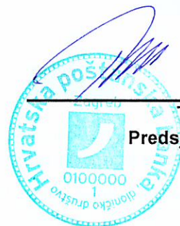
Tomislav Vuić Predsjednik Uprave

Uslijed pokrenutih mjera optimizacije izloženosti rizicima, ali i povećanja regulatornog kapitala, stopa adekvatnosti kapitala na dan 31.03.2017. iznosi 15,84 posto. Porast u 2017. za 0,2 postotna boda ostvaren je na teret profitonosnog kapaciteta.