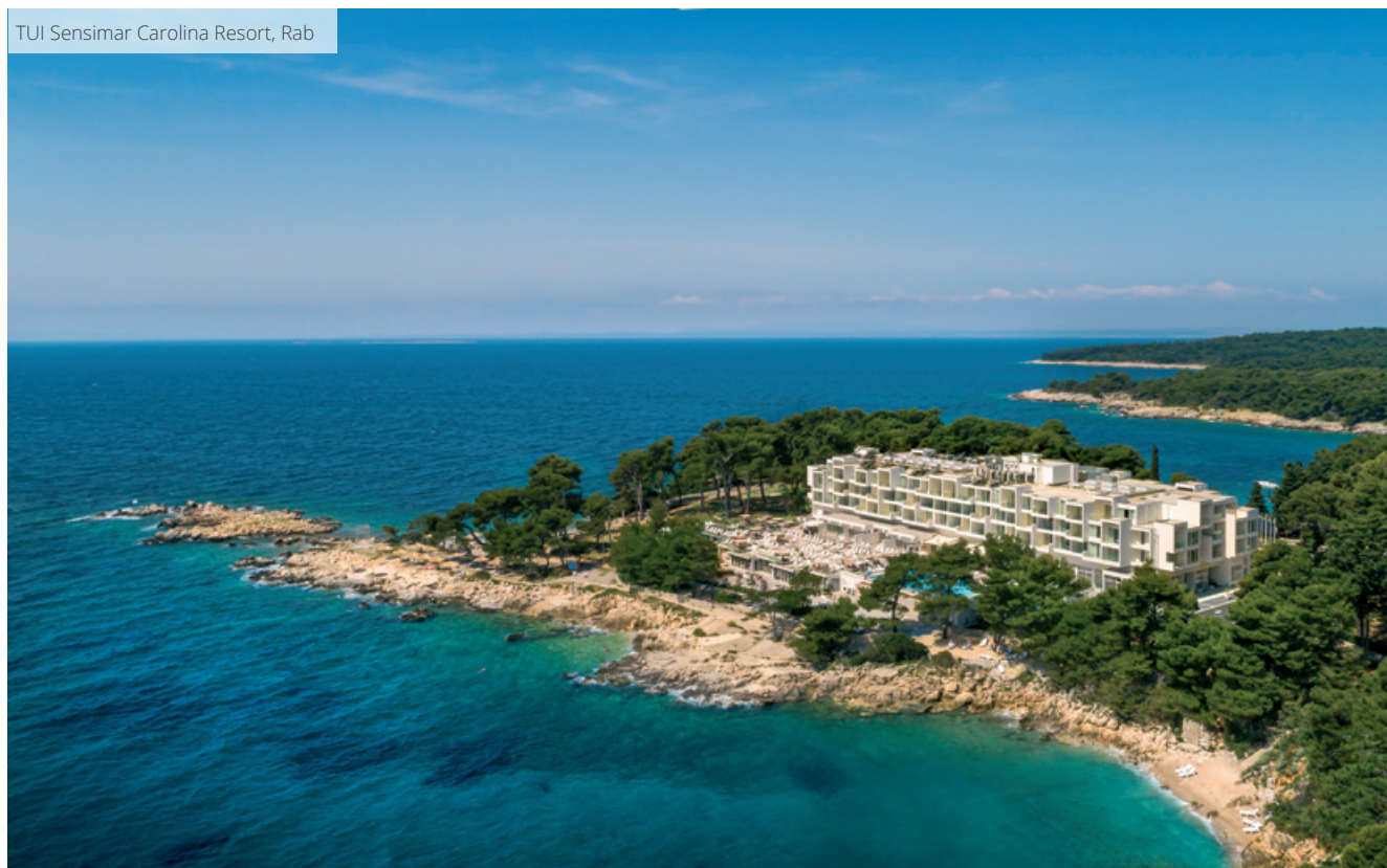
TUI Sensimar Carolina Resort, Rab

Utjecajem većinskog vlasnika Valamar Riviera d.d. poboljšavaju se rezultati poslovanja Imperial d.d. zbog poslovne sinergije koja će i u narednim razdobljima pozitivno utjecati na rezultate poslovanja.