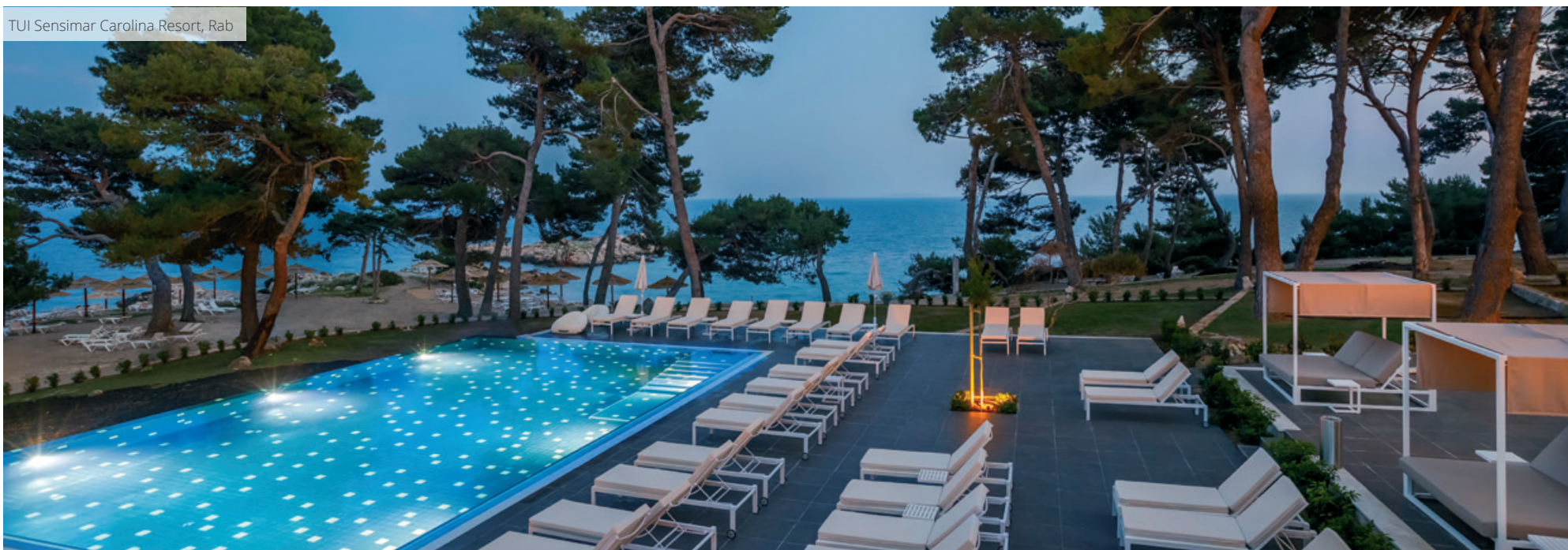
TUI Sensimar Carolina Resort, Rab