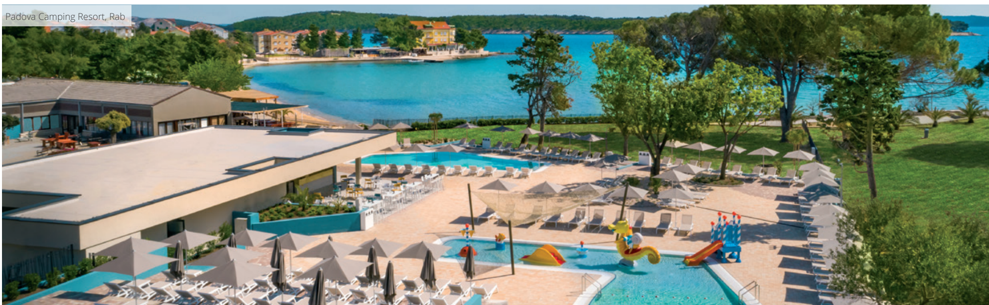
Padova Camping Resort, Rab