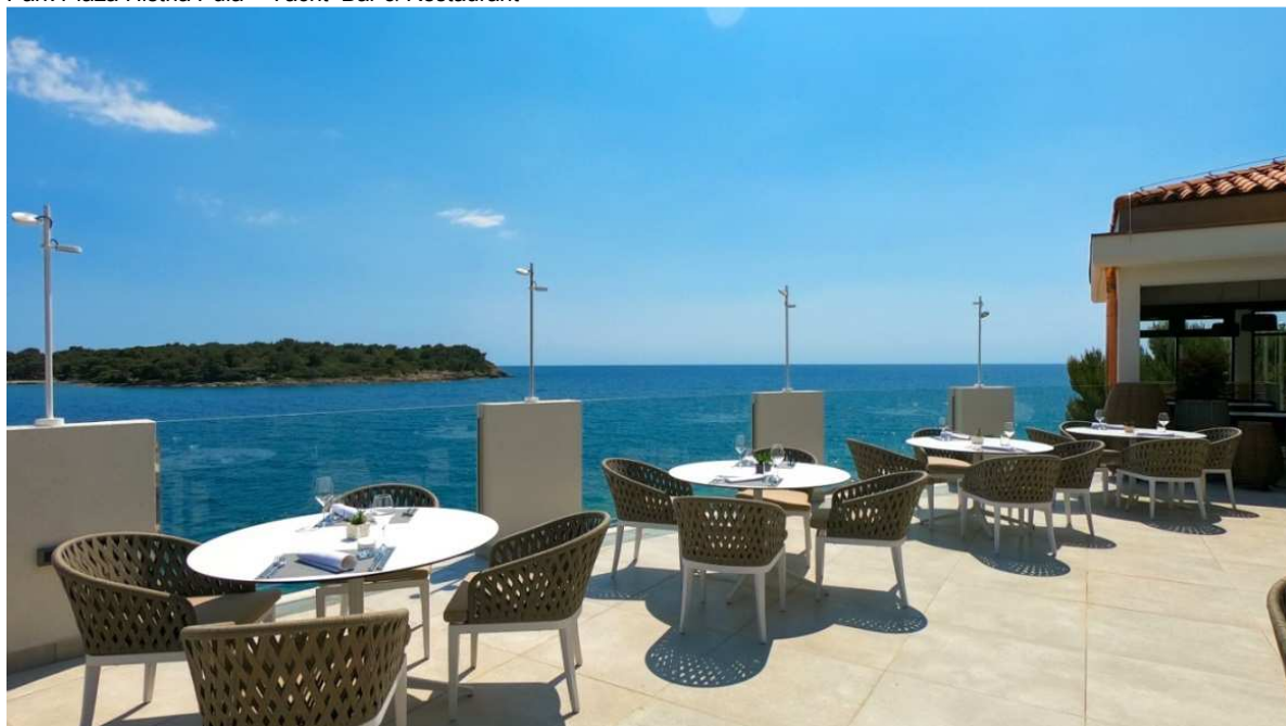
Park Plaza Histria Pula – Yacht Bar & Restaurant