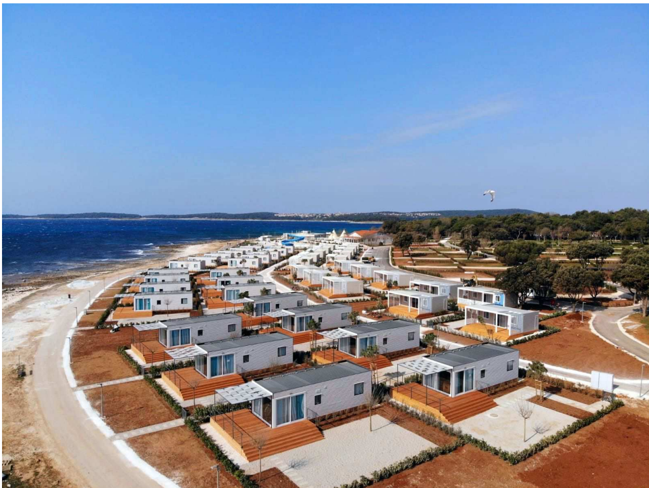
Arena Grand Kažela Campsite