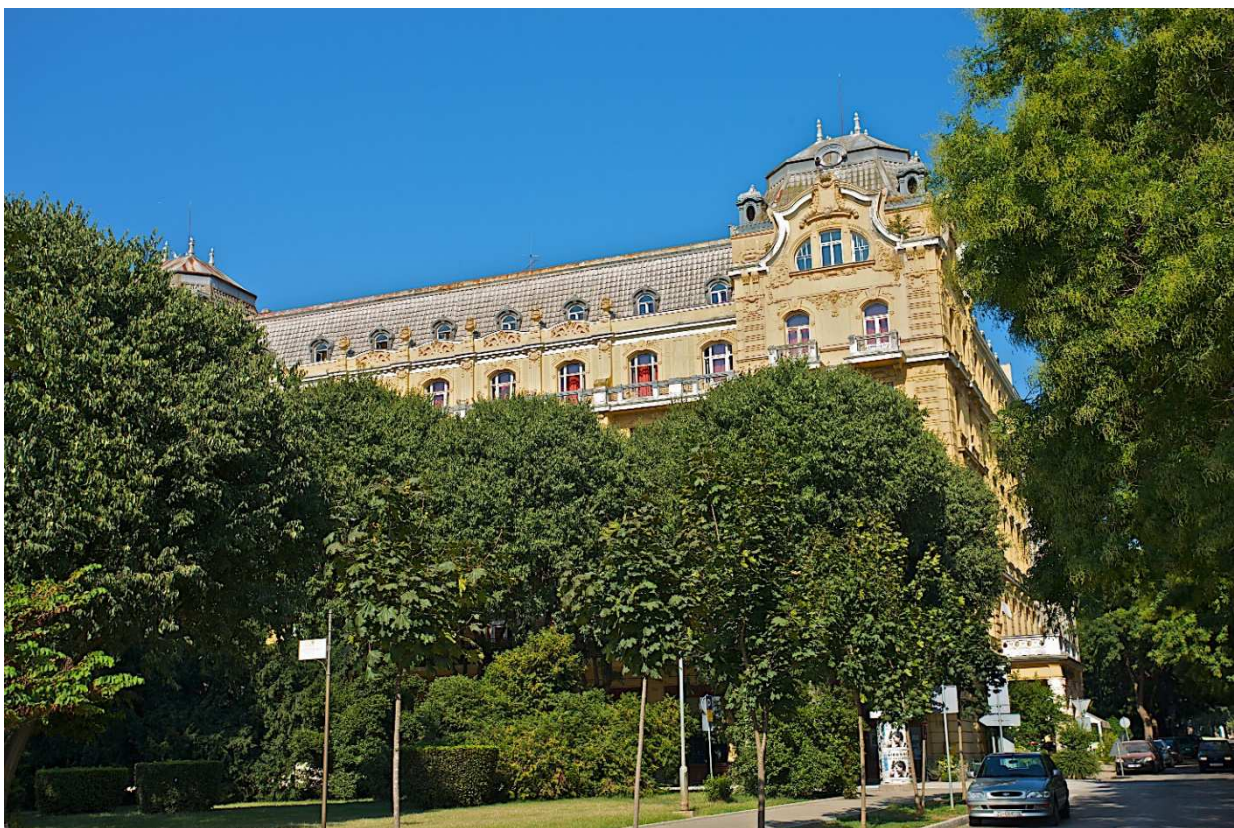
Guesthouse Riviera Pula