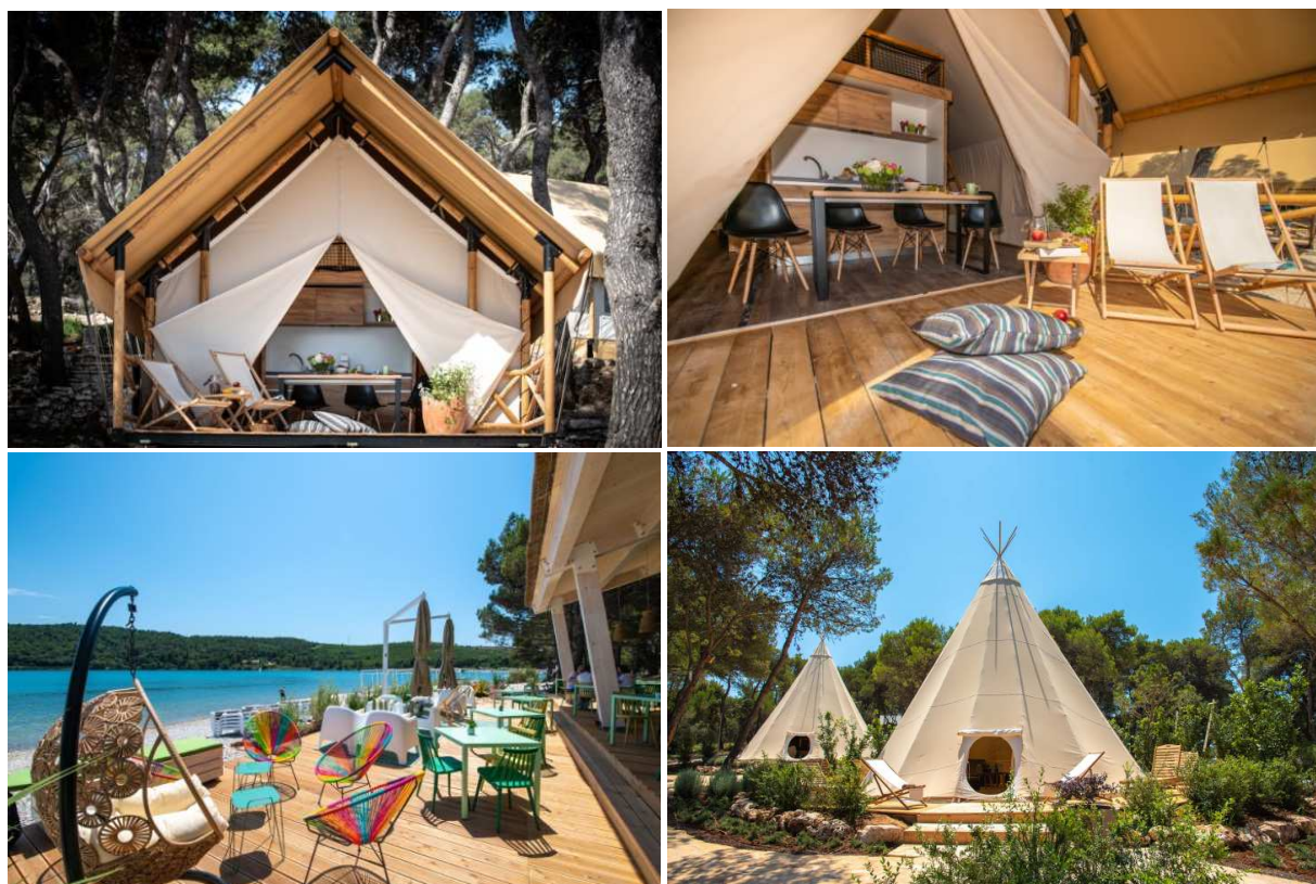
Arena One 99 Glamping - novootvoren u lipnju 2018