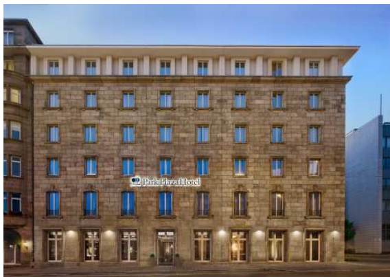
Park Plaza Nurembeg