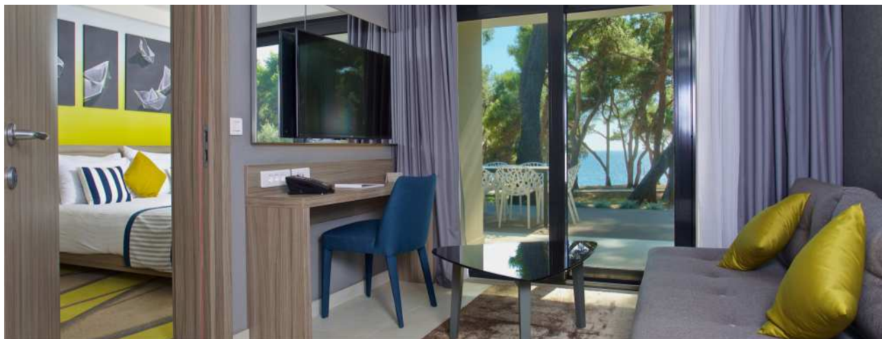
Park Plaza Arena – novi Garden Suites