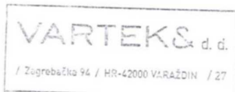
Tomislav Babić /predsjednik Uprave/