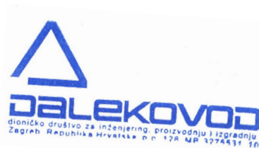
Tvrtko Zlopaša član Uprave