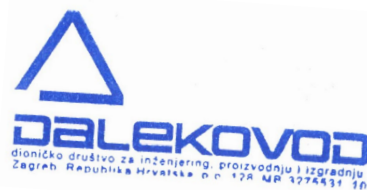
Tvrtko Zlopaša član Uprave