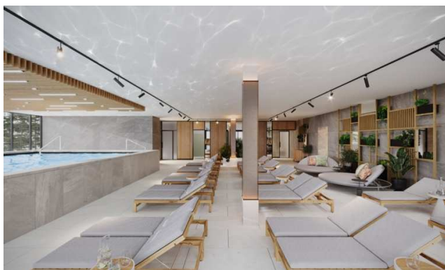
Arena Franz Ferdinand

Grupa planira uložiti 22 milijuna kuna u proširenje wellness sadržaja, izgradnju vanjskog bazena te uređenje soba i javnih površina. Druga faza obnove počela je u drugoj polovici rujna nakon solidnih rezultata ljetne sezone. Radovi se planiraju dovršiti do prosinca 2022. Ova planirana investicija će repositionirati hotel kao odmaralište višeg ranga, s mogućnošću produženog razdoblja poslovanja tijekom zime i ljeta.