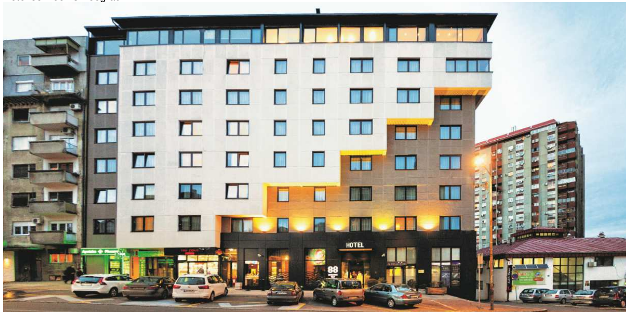
Hotel 88 Rooms Beograd