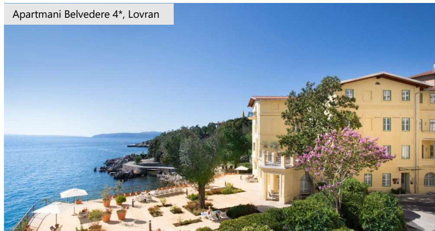
Apartmani Belvedere 4*, Lovran

Društvo je svjesno rizika izloženosti cyber napadima koji mogu rezultirati značajnim poremećajima u poslovanju i financijskim gubicima uslijed pada prihoda, troškova za saniranje štete od napada te značajnih novčanih kazni u slučaju kršenja odredbi za sigurnost podataka, kao i pouzdanosti informatičkih poslovnih rješenja. Utoliko, Društvo kontinuirano radi na njihovom daljnjem razvoju s naglaskom na projekte zaštite podataka, unapređenje postojećih i razvoj i implementaciju novih, suvremenih poslovnih sustava.